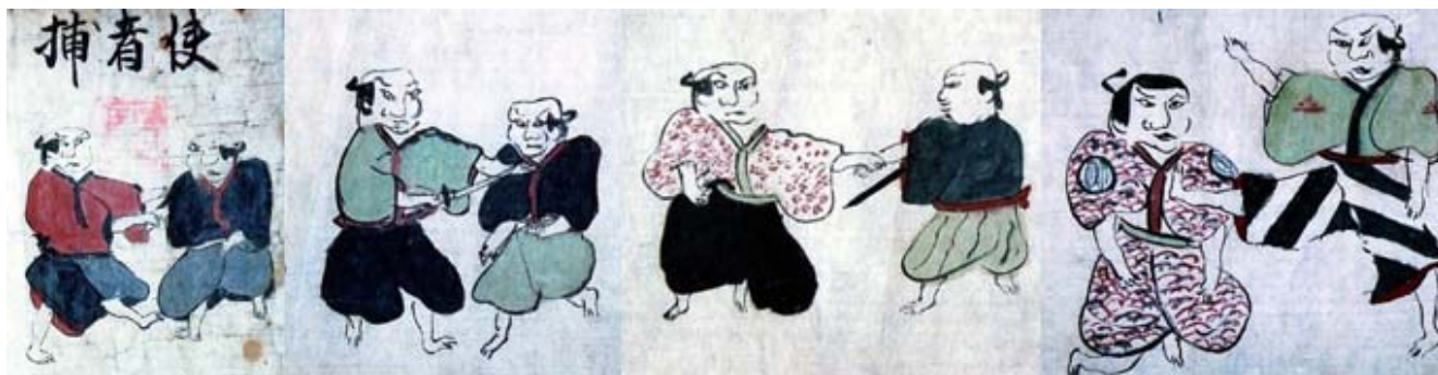
無双直伝和術目録 – Фрагмент Мусо дзидэн ва-дзюцу мокуроку 1734 год

Также некоторые школы в рвении придать значимости своей технике, шли на определённые документальные фальсификации, так как предание школе значимости, по линии преемственности, значительно улучшало социальный статус её наставника и возможность более высокого заработка.